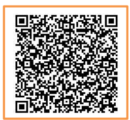
いばらき電子申請・届出サービス QRコード