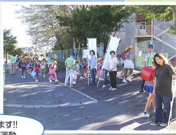
おはようございます!! 小学校あいさつ運動