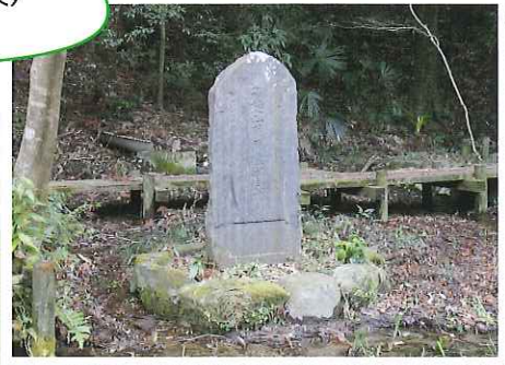
湧水群(箱樋工事再興) 記念碑

自然・湧水の復元と活用 しめる水辺づくり タル・小魚の育つ水辺の再生 歩道・サイクリング・灯籠の復活、整備 地域再発見ツアー