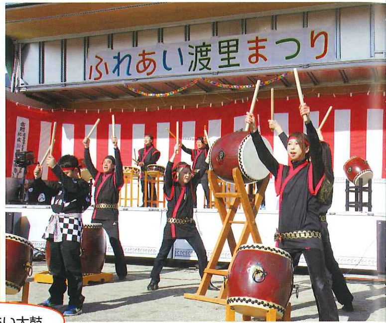
勇壮な渡里ふれあい太鼓