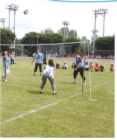
三世代が汗を流す… スポーツ大会