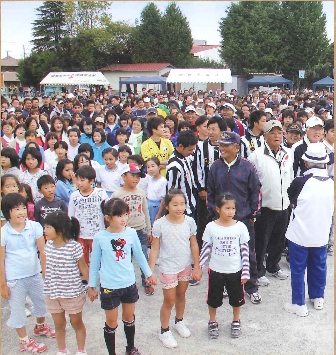
渡里地区コミュニティプラン