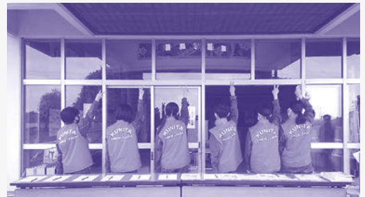
ジュニアリーダーの赤ビブス

なお金と安 全を与える だけだと考 えます。唯 一、形ある物 として与え ているのは、 制服の襟に 輝くジュニア リーダーの 証である桜 のピンバッジ です。このピ ンバッジを身 に着けた子どもたちは、数年経てば進学 や就職で地元を離れるかもしれません。 しかし、この活動経験を通して、生まれ 育った故郷を思い、その時に過ごしてい る地域をも大切に思える若者になつて くれればと思います。