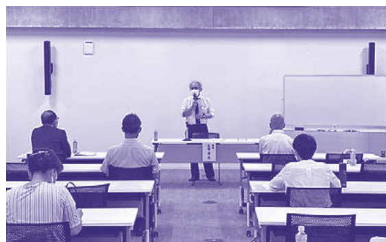
青少年指導者研修会