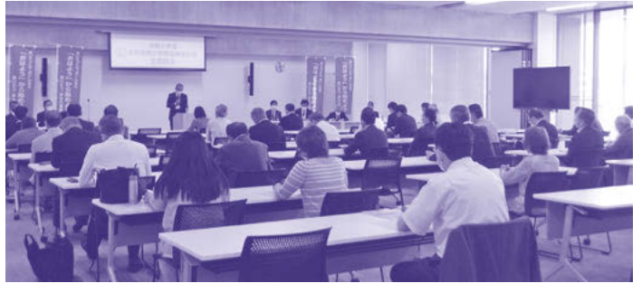
多くの方々に参加いただきました

5月21日、水戸市役所4階の中間会議室において、令和5年度定期総会を開催しました。 当日は多くの関係者にご出席をいただき、役員改選を含め議事は滞りなく進行しました。 未来を担う水戸の子どものために、今年度も市民が、そして私たち推進会議が一体となり見守っていただけるよう、市民総参加による育成活動に、一人一人のご支援とご協力をお願いします。