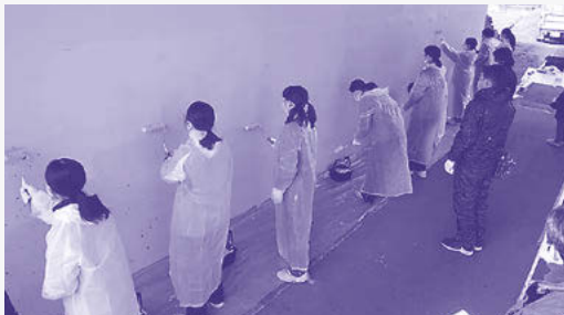
トンネル壁面のらくがき消し作業

人は「場所と 時間とアド バイス」を与 えているだ けで、基本的 に子どもた ちに任せて います。我々 大人の出来 ることは、子 どもたちの 望む活動に 対して、必要