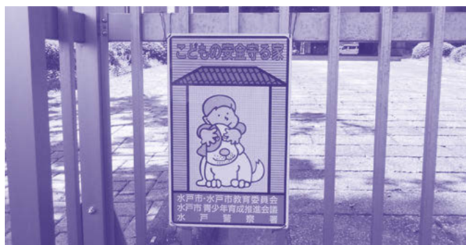
子どもの安全守る家に登録しませんか