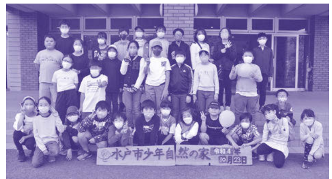
青少年若者体験活動事業

の試みなので、未知の部分がありますが、部員一同、ワクワクドキドキしながら、団結して取り組もうと思います。