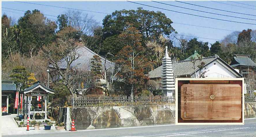
東光寺(大場町)と算額

明治22年4月1日市制・町村制が施行され、旧大場村・下入野村・森戸村・秋成新田が合併し、大場村を中心に合併が進められたことから、新村名を大場村と称することとし、役場を大字下入野字石原に置き、大場村が誕生した。(365戸・2,200人前後)その後、役場は、大正元年に大字大場字伊賀内(393戸・2,308人前後)に、さらに昭和24年に大字大場字2395番地へと移され、昭和30年の常澄村の誕生となった。(10,430人……大場地区2,657人)