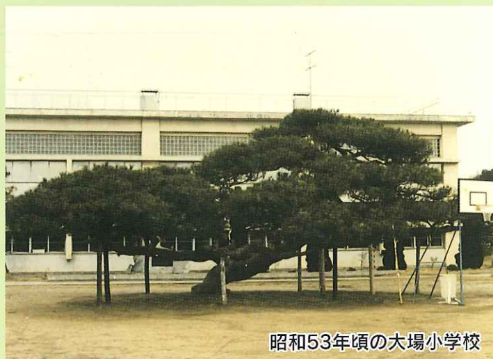
昭和53年頃の大場小学校