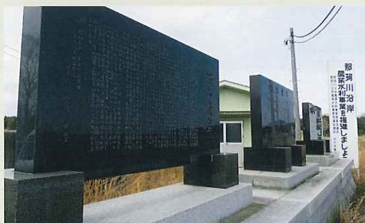
東大場土地改良区拓農基盤整備事業記念碑