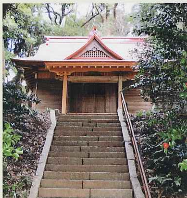
銚(ほこ)神社(大場町)