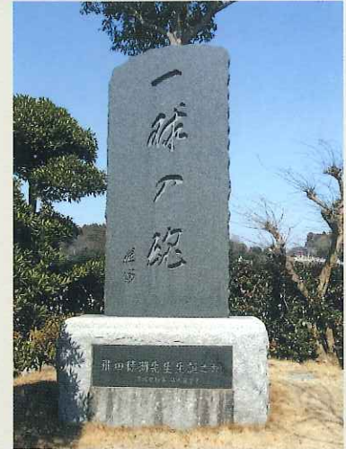
飛田穂州先生顕彰の碑(大場町)