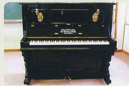
グロトリアンピアノ(大場小)