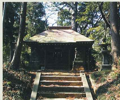
吉田神社(下入野町)