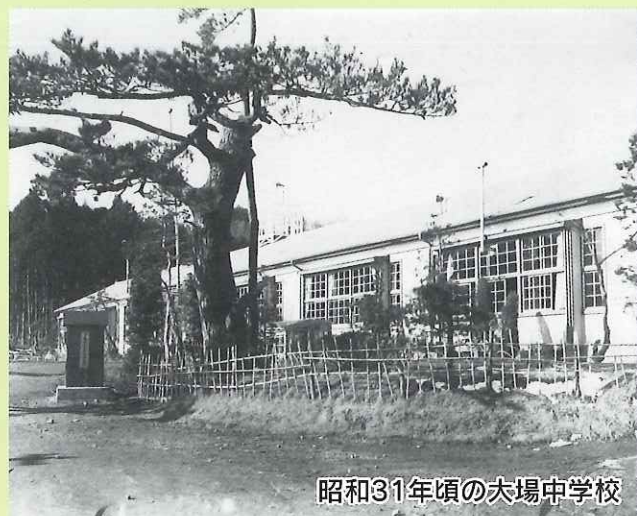
昭和31年頃の大場中学校

平成11年に発足したさわやか大場をつくる会は15周年をむかえ、水戸市新コミュニティプラン推進計画に基づき大場地区の将来像や課題、その解決に向けたアクションプランを計画することとしました。大場の地域を良くする計画づくり委員会を立ち上げ、大場地区の課題、問題をアンケートを介して把握、取り上げその解決策を果たすべくプランを計画し再スタートいたします。