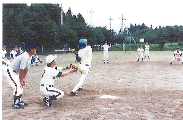
お父さんソフトボール大会