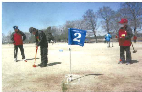
グランドゴルフ大会