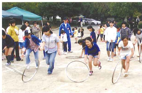
笠原地区市民運動会