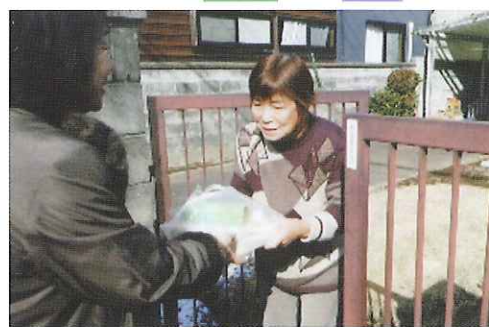
一人暮らしの高齢者への食事宅配