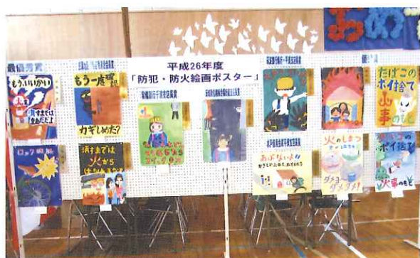
防犯・防火の絵画ポスター募集及び展示と表彰