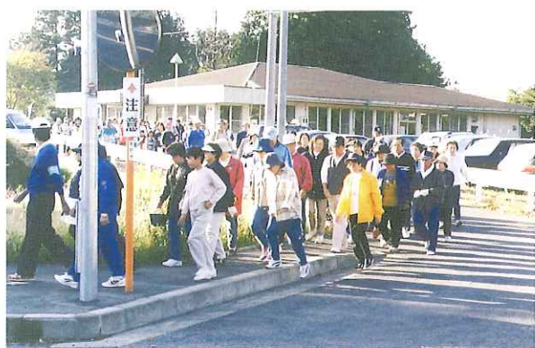
笠原地区市民歩く会