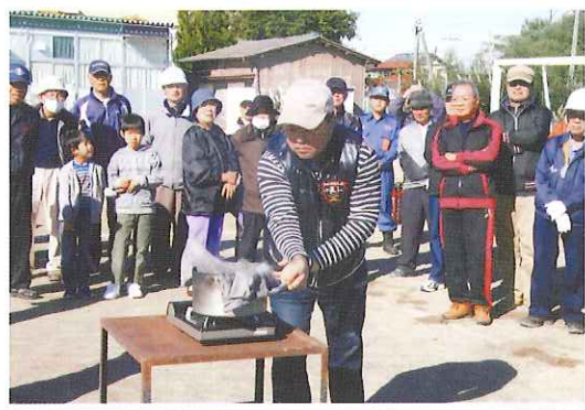
笠原地区防災訓練