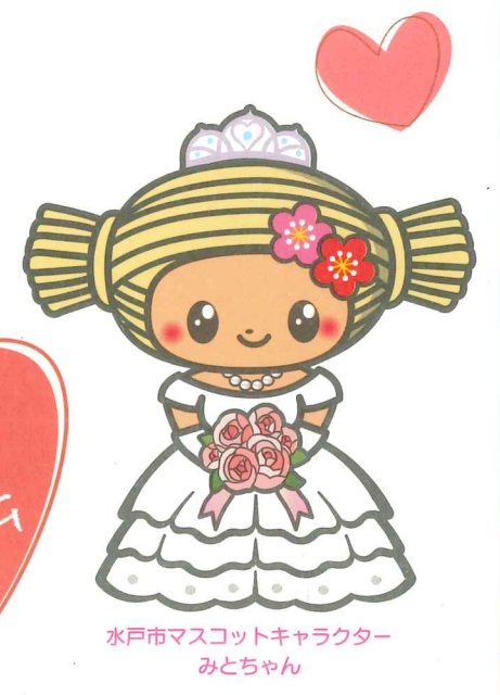
水戸市マスコットキャラクター みとちゃん