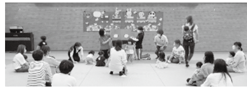
▲絵本の読み聞かせ