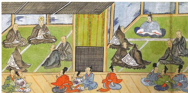
江戸氏家臣が制作に関わった絵巻物 「弘法大師行状図画」(部分) 水戸大師六地藏寺所蔵 茨城県指定文化財