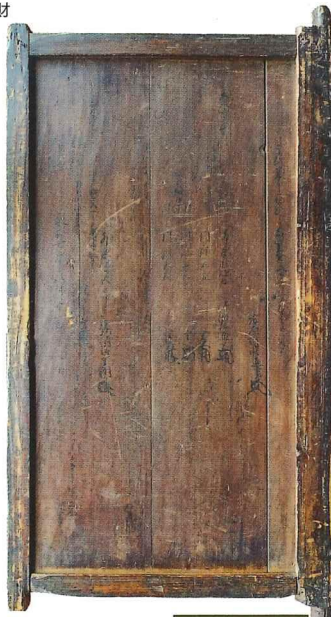
戦場に向かう 江戸氏一族が和歌を書きつけた扉 「小生瀬宝泉寺扉」 妙徳寺所蔵