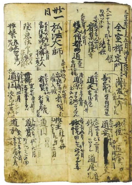
江戸氏一族や家臣の動きがわかる、 菩提寺和光院の過去帳 「和光院過去帳」 和光院所蔵 水戸市指定文化財