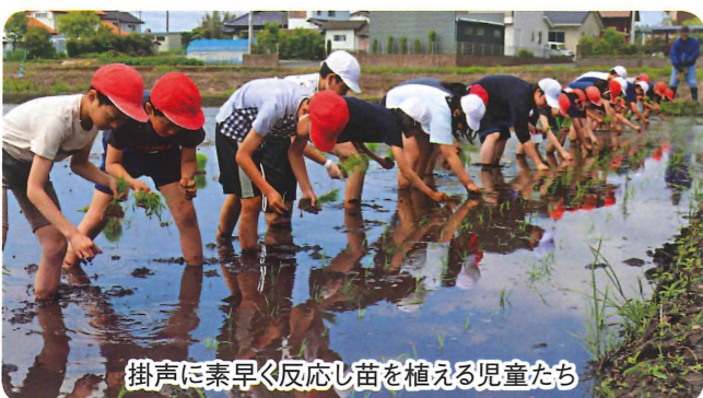
掛声に素早く反応し苗を植える児童たち

最後に全員が「田植えばんざーい」で喜びを分かち合い、体験学習を終えました。あり「気持ちいい！」の声や笑顔の姿が見られました。その後、堤沿いに張られたロープを前に横一列に並び、先生の掛け声に合わせて苗を植え始めました。最初のうちは自分の前を植え終わると立つ姿が目立ちましたが、インストラクターのアドバイスもあって周囲まで手を伸ばし植える要領をすぐに覚え、休憩を挟んで約90分で約10アールの田植えを終えました。