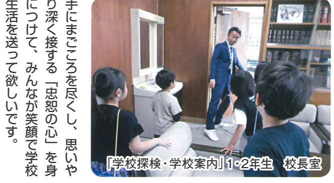
「学校探検・学校案内」1・2年生 校長室

もしっかり身につかないと思われました。 そこで年度当初、子供たちには、まず「元気に挨拶ができる子になって下さい」と話をしました。良好な人間関係を築く第一歩として、誰にでも挨拶ができる子になって欲しいと思っております。地域の皆様も子供たちに声かけをお願いします。 また、令和の日本型学校教育で求められている協働的な学びでも、他者との関わりが必須です。多様な人々と協力して、相