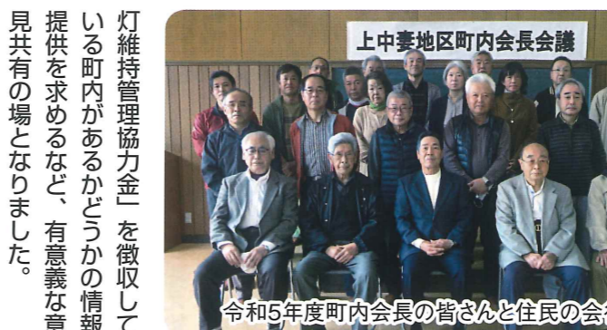
令和5年度町内会長の皆さんと住民の会役員

令和5年度 町内会長研修会開催 4月16日(日)市民センターホールで、年度初めの町内会長研修会が行われました。 今年度は、上中妻地区19町内会のうち12町内会の会長さんが新しい方に代わられた中で開催されました。 令和5年度版「町内会長の手引き」を使って、上中妻地区内町内会加入率の現状や共通の取り組み・各種補助金申請の手続き・窓口相談など町内会運営全般について研修を行いました。 続いて意見交換が行われ、町内会未加入世帯から「防犯