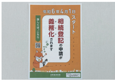
相続登記申請義務化のポスター

A 市内調査が未実施のため所有者不明土地を把握できていない。現状把握に努めるとともに、相続登記の重要性を認識してもらえよう。申請義務化の周知、普及に努める。