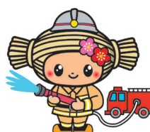
水戸市マスコットキャラクター