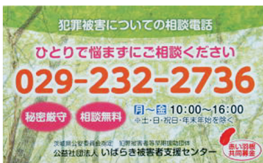
犯罪被害者についての相談電話の案内