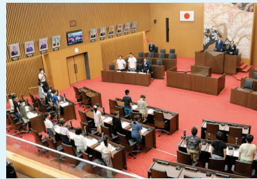
こども議会の様子