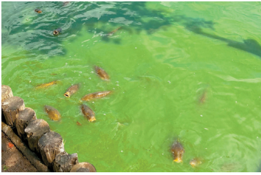
千波湖水面に広がるアオコ

A 7月下旬以降は那珂川の流量減少で通水できず千波湖がアオコに覆われた。導水の効果を再認識した一方、導水できない期間が連続すればアオコ発生が懸念されるため、導水を補う手法を調査検討する。