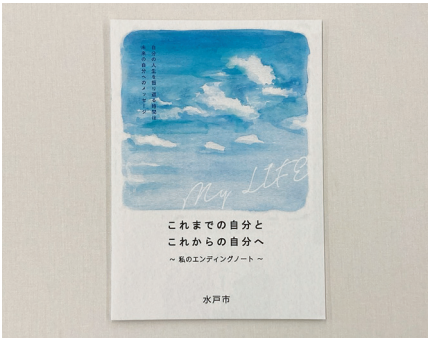
エンディングノート

A 終活情報の登録制度は効果的な手法であることから、課題等を整理し、導入に向けて準備を進める。終活あんしんセンターの設置については、運営方法や実施主体等については、引き続き調査研究を行う。今後も相談対応等に取り組み、終活支援体制の強化に努める。