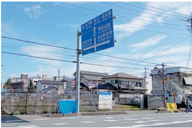
茨大付近への交番(新設)の工事現場