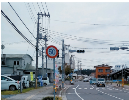
内原小学校正門前の道路

A 市通学路安全対策推進会議において、危険箇所解消に向けハード、ソフト両面での対策を計画的に講じている。時間を要する箇所では、路側帯のカラー化など必要な対策を可能なものから実施するほか、地域の協力もいただきながら、児童生徒の安全確保を図っている。