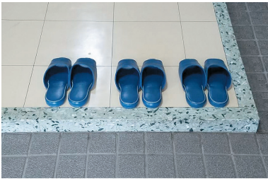
市民センターのスリッパ

A 土足対応の市民センターは全34か所中10か所である。改築工事や長寿命化改修工事などに合わせ、土足利用の可否については地区の意向を尊重し、整備を進めている。今後、バリアフリー化やユニバーサルデザインの導入に取り組み、市民の声を施設運営に反映する。