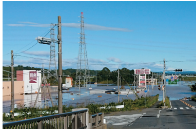
令和元年水害時の水戸北IC付近

A 国田地区では、自然堤防の一部かさ上げや重力式擁壁の設置を行う予定であり、対象地の現地測量等が完了した。飯富地区では、田野川において県と市が連携し、市道飯富153号線下田橋の架け替えや道路改良工事と一体となった河川改修事業を進めている。柳河地区では、土砂の掘削や樹木の伐採を行い、水位の低減を図っている。今後国や県と連携し、災害に強いまちづくりの実現に取り組む。