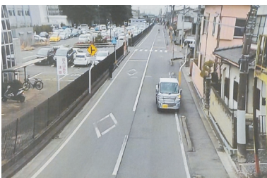
茨城大学周辺の防犯カメラの映像