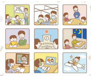
多様な教育(イメージ)

A 県において、運営者及び経済的な事情のある世帯を対象に補助を行うフリースクール連携推進事業を実施しており、本市でも同制度が掲載された不登校支援のチラシによる周知等を行っている。今後は県制度の活用状況を注視するとともに、先進事例等を調査し、補助制度の在り方について研究する。