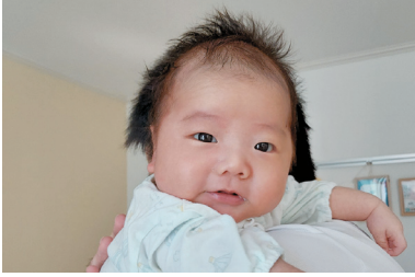
父親に抱っこされる赤ちゃん

A (1) 末広町交番が当該交差点付近に移転となり、建設に向けた工事を発注済みと聞いた。名称に関する住民要望の趣旨を水戸警察署に伝える。(2) 被害軽減は喫緊の課題であり、今年度から貯留管工事に着手し、令和7年度の完成に向け整備を進めている。県と連携を図り、着実な対策・工事の進捗に努める。