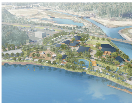
事業者提案のイメージ図(千波公園)

A (1)昨年11月に事業者を選定し、1月に基本協定を締結した。物価高騰による資金計画の修正やテナント出店者等との調整に時間を要しており、開業は令和7年秋以降の見通しである。(2)若い世代も楽しめる様々な施設整備が計画されており、世代を超えた交流とより一層のにぎわい創出が期待される。