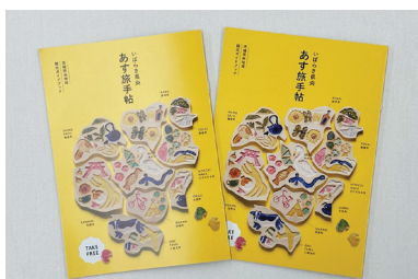
県央地域観光ガイドブック

A (1) いばらき県央地域観光協議会が主体となり、各種事業を展開している。引き続き協議会のHPやインスタグラムによる情報発信に努める。今後も本市が中心的な役割を果たしながら、広域連携ならではの魅力あふれる取組を展開する。(2) 10月7日～9日、市民会館1階やぐら広場をメイン会場に、姉妹・親善都市と交流都市の観光と物産展を開催する。