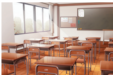
学校の教室(イメージ)

A (要望) 新たに、担任ローテーション制度の導入を提案したい。当該制度は1人の教員に学級担任を1人するのではなく、複数人で担任をローテーションするものである。担任の負担や重圧が軽減され、生徒にとっても利点が多いと考える。