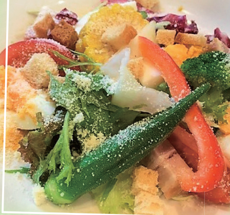
Cooking using Ibaraki ingredients