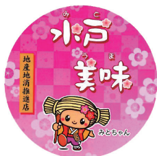
【店舗掲示ステッカー】