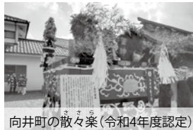
向井町の散々楽(令和4年度認定)

「水戸市地域文化財」は、市内のそれぞれの地域で大切に守り伝えられている文化財を後世に残すための制度です。認定を受けた地域文化財には、市が修理や保存・活用方法について助言や情報提供をするほか、案内板の設置、教育活動やイベントなどで活用していきます。ただし、修理や保存などに関する補助はありません。