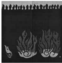
「炎」(市立博物館所蔵)