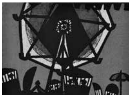
「遊園地」(市立博物館所蔵)