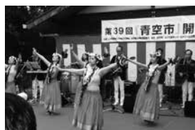
▲ステージイベント