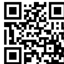
メール申込用 QR コード