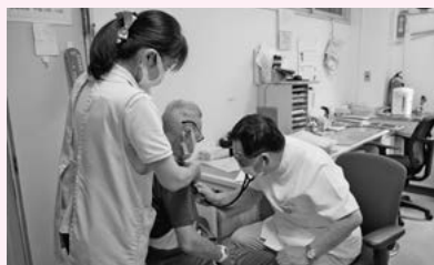
定期的な診察で、安心な生活