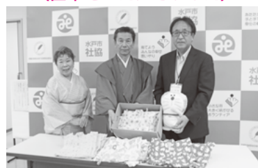
NPO 法人きもの文化を大切にする会 県央支部様