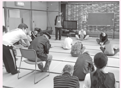
身体を動かして健康に気を付けています