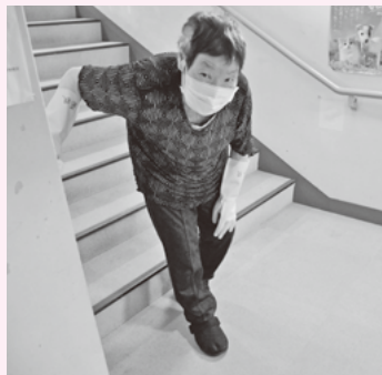
お掃除はお手の物