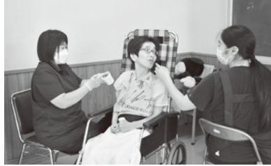
何気ない会話が元気の源