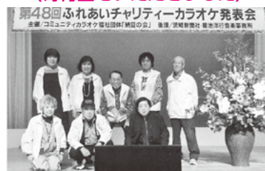
コミュニティカラオケ福祉団体「納豆の会」様