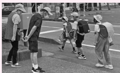
朝の挨拶は気持ちよく