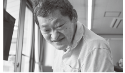
笑顔あふれる生活に