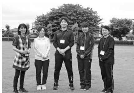
研修後の新規採用正規職員