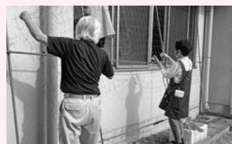
グリーンカーテンを作っています