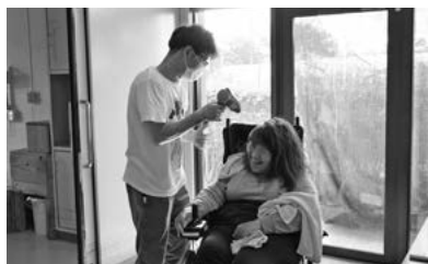
ドライヤーの風量は強めにね