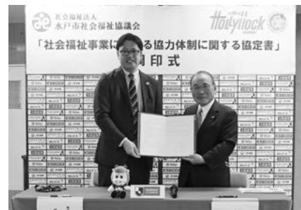
(株)フットボールクラブ水戸ホーリーホックと「社会福祉事業における協力体制に関する協定書」締結式