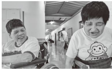
顔を合わせてにっこり