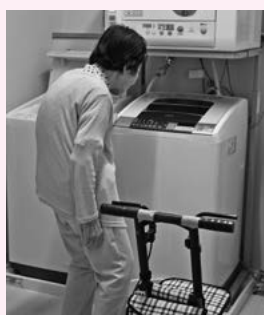
洗濯の終わる頃かしら