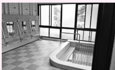
自慢の大浴場で身体もぼかぼか