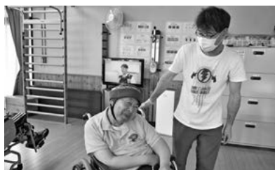
日頃からのコミュニケーションが大切