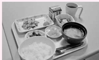
工夫をこらした美味しい食事