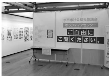
ボランティアサークルパネル展