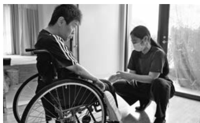
足の指もきちんと清潔に