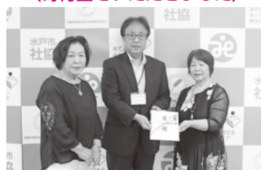
歌を楽しむわかばの会様