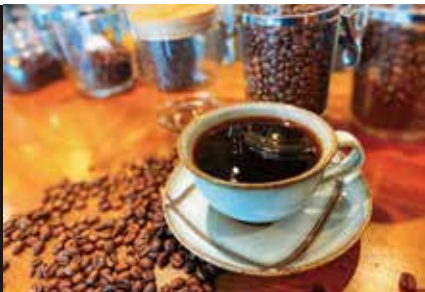
城里ブレンド、ゆうだい21(お米)、 ななかいの里コシヒカリ