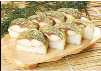
焼き鯖寿司、敦賀ふぐ、 角鹿の塩ラーメン(実演)、羽二重餅 ほか