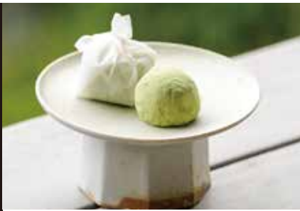
埋れ木、近江牛カレー、 赤こんにゃく、煎茶朝宮 ほか