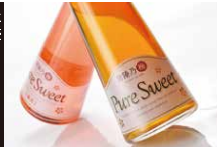
常陸乃梅シロップpure sweet、 踊るちりめん、しらすせいべい ほか