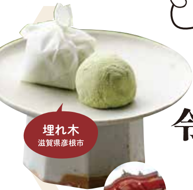
埋れ木 滋賀県彦根市