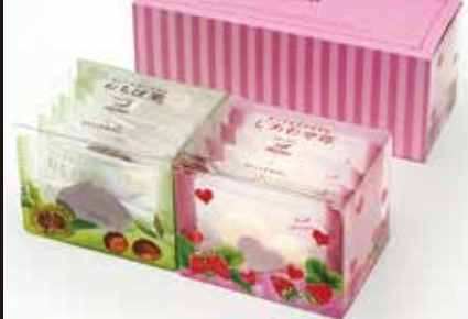
おちば栗&しあわせ苺、クマの手作りもなか、 焼栗アイスクリーム ほか