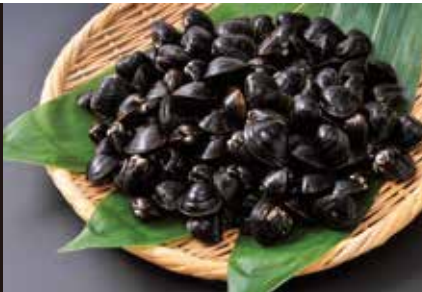
ひぬまヤマトシジミ、 ハーブティー ほか