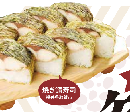
焼き鯖寿司 福井県敦賀市