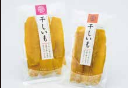
極上の干し芋、なかみなどマドレーヌ、 甘熟やきいも