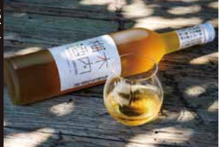
木内梅酒、クリームパン・カレーパン、 ひまわりオイル ほか