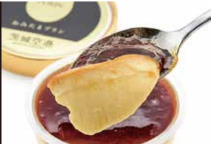
おみたまプリン、 チーズインバウム ほか