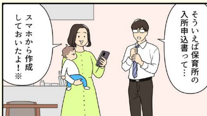
※令和5年度中に開始予定