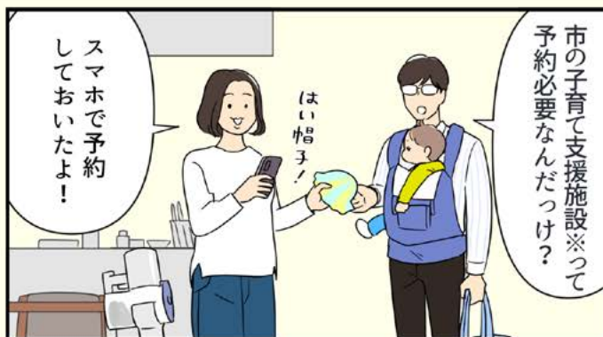
※市の子育て支援施設…わんぱく・みと、はみんぐぱく・みと