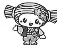
水戸マスコットキャラクター みとちゃん