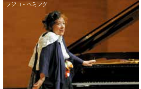
フジコ・ヘミング