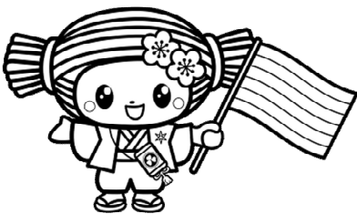
No.51 レインボーフラッグ