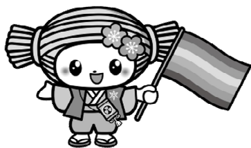
No.51 レインボーフラッグ