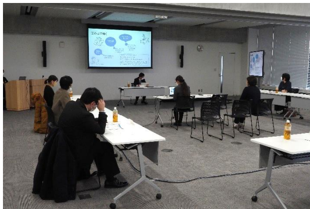
発表の様子（令和4年度）