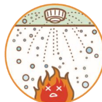
②スプリンクラー設備