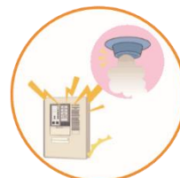
③自動火災報知設備