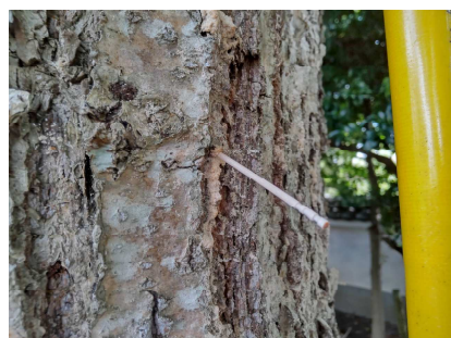
カシノナガキクイムシ穿入穴