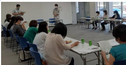
東部ガス株式会社茨城支社にて