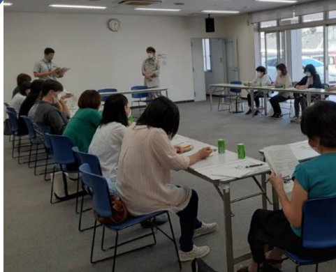
R3.5.25 東部ガス株式会社茨城支社 「ガス検針員連絡会議」にて