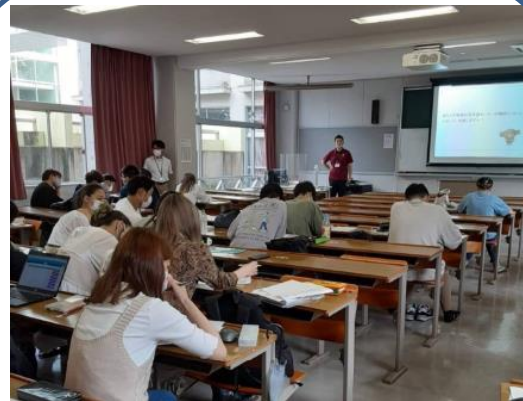
R3.7.13 常磐大学 講義 「ソーシャルワークの基盤と専門職」にて