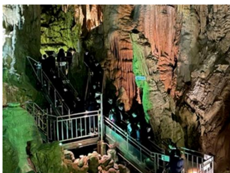
福島県あぶくま洞（第四中）