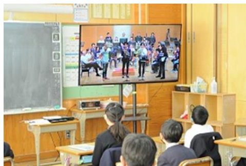
子どものための音楽会（DVD鑑賞）