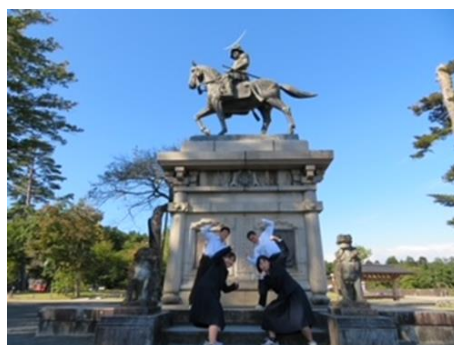
宮城県仙台城址（第五中）