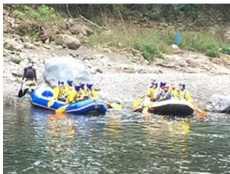
山梨県ラフティング体験（第三中）