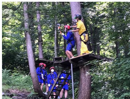
群馬県ジップライン体験（国田義務教育）