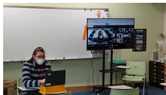
オンライン授業の様子