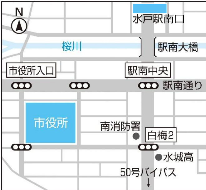
1 地図 (水戸駅～水戸市役所)