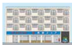
昭和35年に水戸で初めて開店した西部ストア1号店の再現イラスト

昭和30～40年代の水戸のにぎわいを中心に、懐かしい昭和の風景を紹介します。 期間▶10月22日(土)～11月27日(日) 場所▶市立博物館