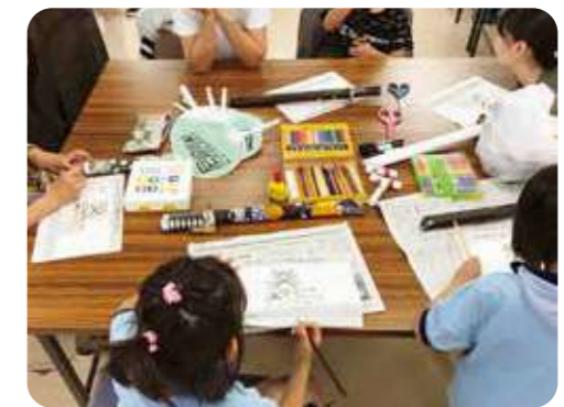
「護美奉行(ごみぶぎょう)」が使う「刀トング」をみんなで製作

阪神尼崎駅近くの商店街に、高齢者や子ども、商店街の活性化や住民のコミュニティづくりまで幅広い事業を行う協同労働の団体があります。設立したのは、この街で生まれ育った仲間たち。造園と介護事業をはじめ、子ども食堂の運営、児童デイサービス、地域の商店街活性化をめざしたイベント、地域連帯プロジェクトなど多彩な事業を展開しています。