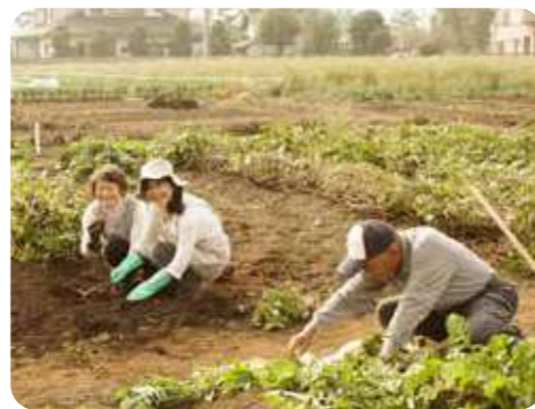
「親」も「地域」も「働く仲間」もみんなで楽しく畑仕事

埼玉県ふじみ野市にある平屋建ての地域密着型デイサービス。ここは「自分の親を預けたいと思えるデイサービス」として知られています。周囲には畑が広がり、利用者は機能訓練を兼ねた農作業を楽しんでいます。収穫した野菜はデイサービスの食事として供され、「おいしい」と評判です。ここでは、農業と食、地域が生き生きとつながったデイサービス事業が実現しています。