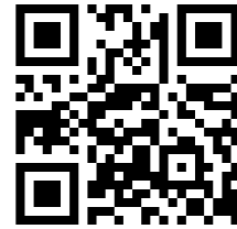
メール申込用QRコード