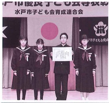
優良子ども会を受賞して 百合が丘子ども会

ぼくたちの子ども会は、みんな仲が良く、学校で他学年の子に会えば言葉をかけあいます。今年度は、最上級生として、また、姫子よつば子ども会の会長として、全部の行事に楽しく参加して、下級生の手本になれるようにがんばります。優良子ども会を受賞できて、とてもうれしです。