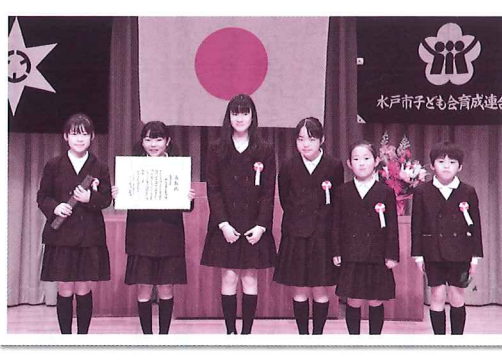
優良子ども会を受賞 新住吉子ども会

な行事がありました。町内会夏祭りでは、子ども会でスーパースポーツやバザーのお店を出しました。大変な所もあったけど楽しかったです。六年間楽しく活動できて、最後に優良子ども会を受賞できたのも、サポートしてくれた保護者の人のおかげだと思っています。本当にありがとうございます。