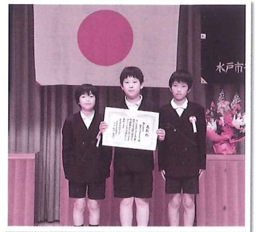
優良子ども会を受賞して 姫子よつば子ども会