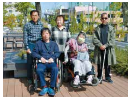
自立支援センター ライフサポート水戸の皆さん

最近、障害者に対して親切な人が増えたと思います！でも、急に腕などを掴まれると驚いてしまうので、介助してくれる時は、先に声を掛けてくれると嬉しいです。子どもだけではなく、大人に向けたバリアフリー教室もあったら良いですね。