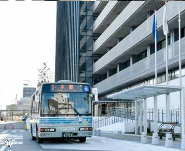
①市役所乗り入れるバス ②車内の消毒の様子 ③混み合うバス停の様子(水戸駅北口) ④鹿島臨海鉄道の列車 ⑤1,000円タクシー妻里・山根号

通勤・通学、通院など、日常生活を支える公共交通。消毒や換気など、新型コロナウイルス感染症の対策を徹底していますので、安心して利用できます。公共交通を将来にわたり持続可能なものにするため、今のまちに合った交通体系づくりを進めていきます。