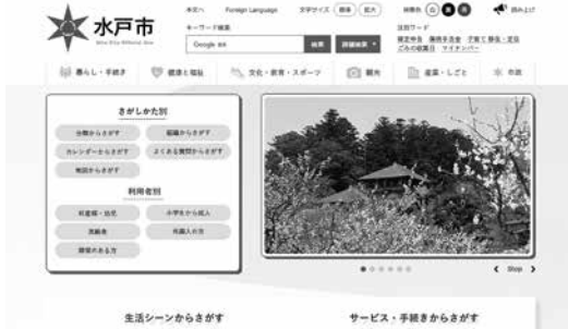
新しい市ホームページのイメージ