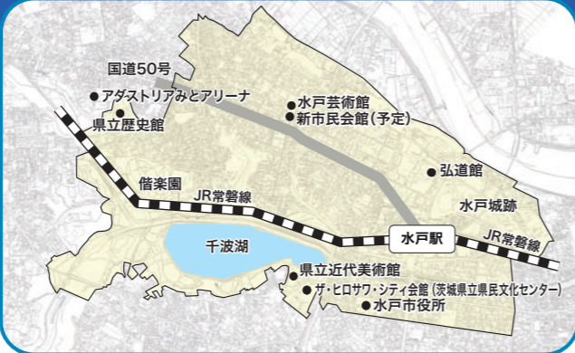
水戸市の中心部(都市核)