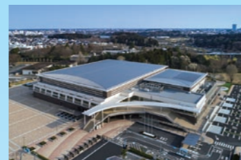
アダストリアみとアリーナ