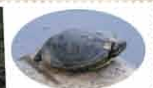
池ではカメやさかなの観察ができます。