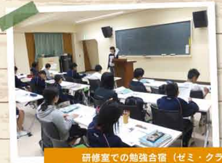
研修室での勉強合宿 (ゼミ・クラス・企業の若手職員研修) や、グラウンドや多目的ホールを使っのスポーツ合宿にもご利用いただけます。