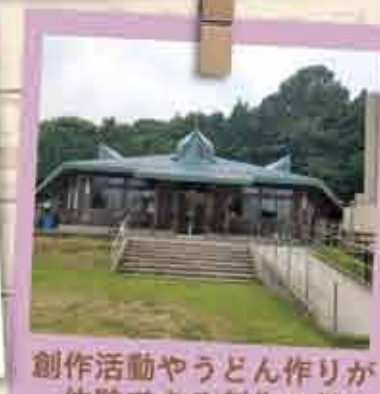
創作活動やうどん作りが体験できる創作の館