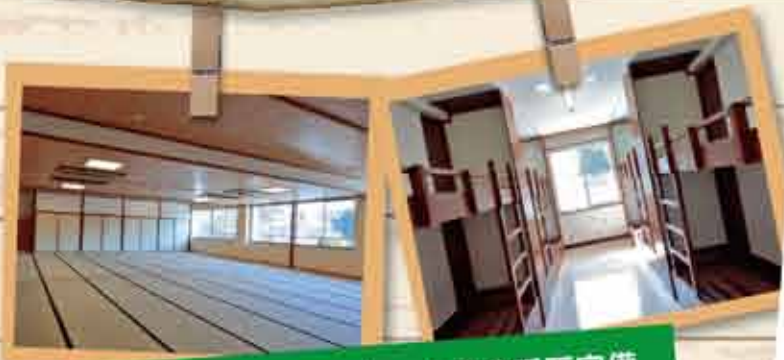
宿泊定員は 223 人 全室冷暖房完備