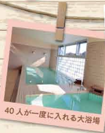
40 人が一度に入れる大浴場