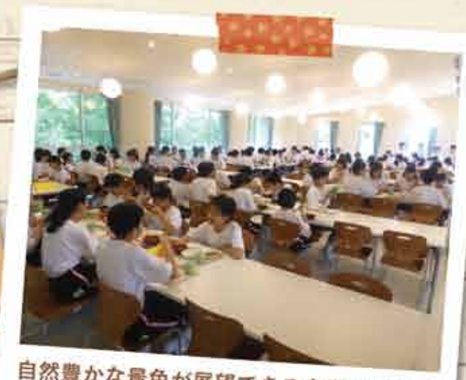
自然豊かな景色が展望できる食堂 (250 席)