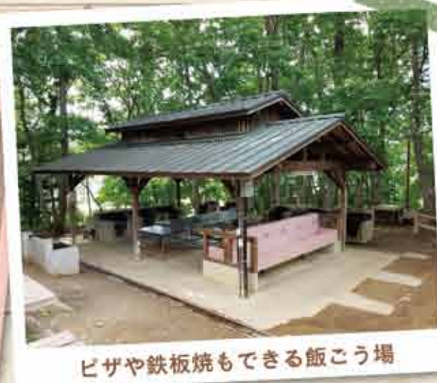
ピザや鉄板焼もできる飯こう場