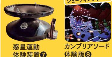
惑星運動体験装置⑦