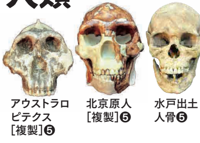
アウストラロピテクス [複製]⑥