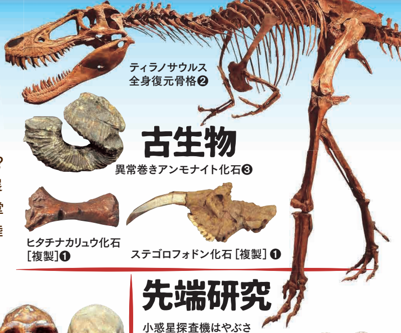
ティラノサウルス 全身復元骨格②