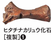
ヒタチナカリユ化石 [複製]①