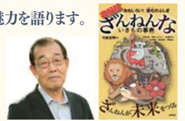
「さらにざんねんないきもの事典」▲