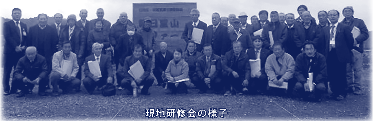
現地研修会の様子