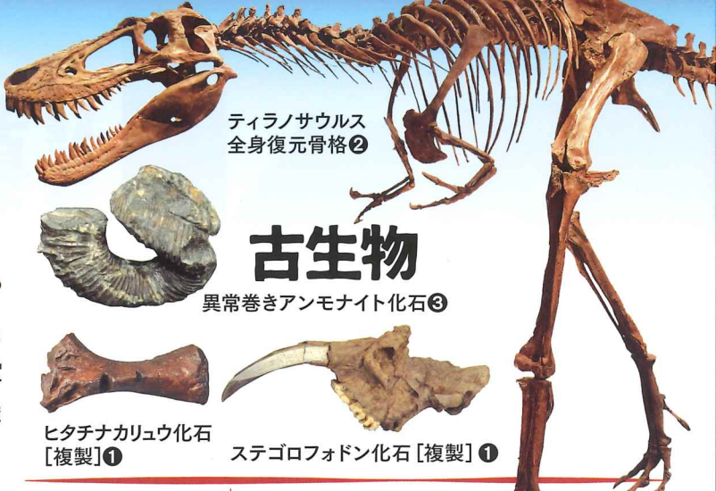
ティラノサウルス 全身復元骨格②

水戸はいつできたのか？太古の水戸にはどんな生物がいたのか？ 未来の水戸はどう変化するのか？—そんな疑問に答えるため、本展覧会では、宇宙科学・地質学・古生物学・考古学などの資料を一堂に集め、138億年前の宇宙誕生から、2億年後のアメイジア超大陸が形成されるまでの、140億年間に及ぶ水戸の歴史をたどります。