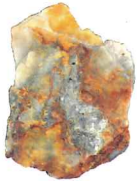
木葉下金山の金鉱石①