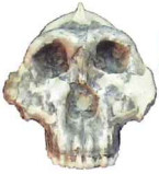
アウストラロピテクス [複製]⑥