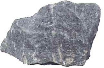
世界最古の石 (アカスタ片麻岩)④