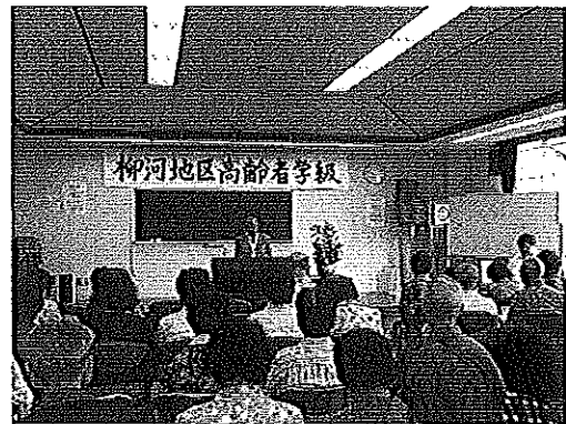
H27. 6. 26 柳河地区高齢者大学