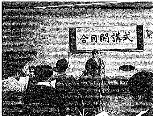
H27. 4. 24 合同開講式