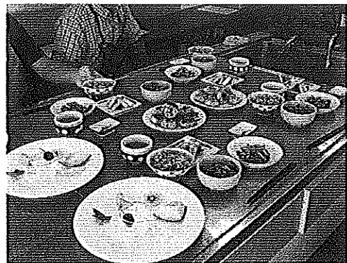
H27. 5. 16 男の料理教室