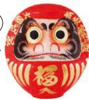
だるまの 生産日本一

◎この特集についての問い合わせは、政策審議室☎(632)2115、広報広聴課☎(632)2028へ。