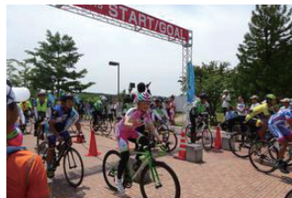
4市を自転車で巡る長距離サイクリング「北関東400キロメートルブルベ」

北関東3県の中核的な都市である水戸市、前橋市、宇都宮市、高崎市。4市が個々の都市力の向上を図るとともに、互いに協調・連携し、北関東全体としての魅力などを高めることを目的に、平成26年4月に「北関東中核都市連携会議」を設置しました。これまで、「北関東400キロメートルブルベ」などさまざまな取り組みを実施しています。 本市から北関東自動車道で、約1時間で行くことができ、身近な存在である3市。そんな本市と結び付きの強い、魅力あふれる3市に皆さんも訪れてみませんか。