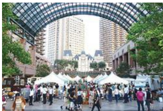
首都圏での4市連携物産フェア 「きたかんマルシェ」