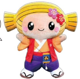
水戸市マスコットキャラクター みとちゃん