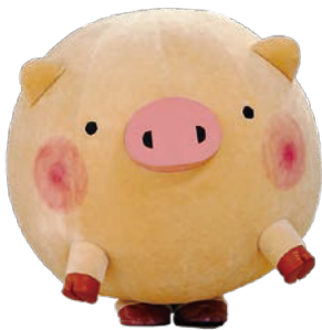
前橋市マスコットキャラクター ころとん