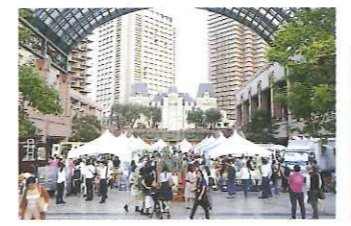
首都圏における4市連携物産フェア「きたかんマルシェ」