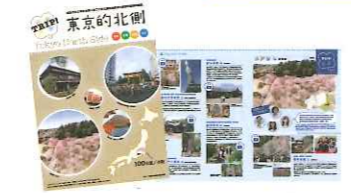
台湾向け北関東観光パンフレット「TRIP!東京の北側」作成