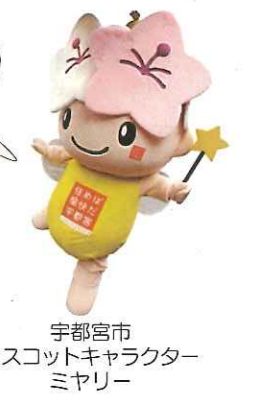
宇都宮市 マスコットキャラクター ミヤリー

ジャズ 宇都宮市は、世界的なアルトサックス奏者、渡辺貞夫さんを筆頭に、多くのジャズプレイヤーを輩出しています。市内のライブハウスでは、毎日ジャズライブが開催されるなど、日常的にジャズを感じることができます。