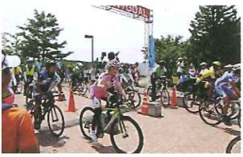
4市を自転車で巡る長距離サイクリング「北関東400kmブルベ」

北関東3県の中核的な都市である水戸市、前橋市、宇都宮市、高崎市。これらの4市が連携・交流し、北関東全体としての魅力などを高めることを目的として、平成26年4月に、「北関東中核都市連携会議」を設置しました。これまでに、共同観光PR事業「ランドネきたかん」など、さまざまな取組を実施しています。 北関東自動車道の開通で、水戸市とより身近な存在になった3市。それぞれに魅力あふれるまちを訪れてみませんか。 問合せ/政策企画課(☎3501580)