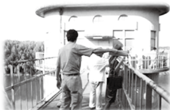
施設見学のようす

水道部ではよりよい事業運営を行っていくために、施設見学や意見交換会を通して水道事業のことを知っていただき、お客様のご意見、ご提案をお寄せいただく「水戸市水道モニター制度」を実施しております。