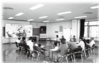
モニター会議のようす

次年度においても、3月上旬から4月上旬の間に水道モニターを募集する予定です。水戸市の水道について日頃感じていることなど、よりよい事業運営のため、ぜひ水道モニター制度に参加して意見をお聴かせ下さい。