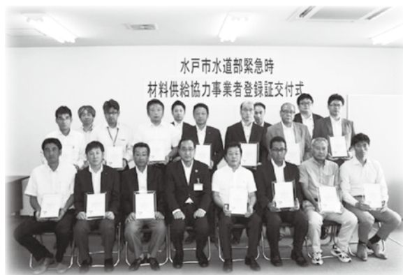
8月18日に行われた登録証交付式にて