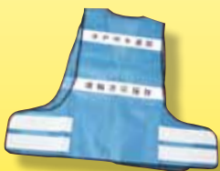
水戸市水道部退職者応援隊

水道に関する知識、技能や経験を活かし、大規模災害時における応急給水体制の強化を図るため、「水戸市水道部退職者応援隊」が発足しました。