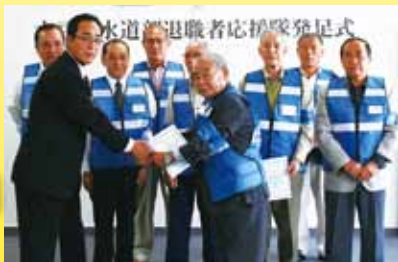
10月8日に水道部にて執り行われた応援隊発足式の様子