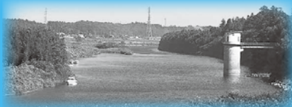
水戸の水源 那珂川

水質検査は、検査結果の精度と信頼性が認められる「水道GLP※」を取得した浄水管理事務所で行っています!!