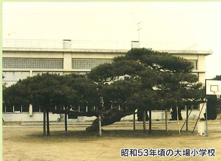
昭和53年頃の大場小学校