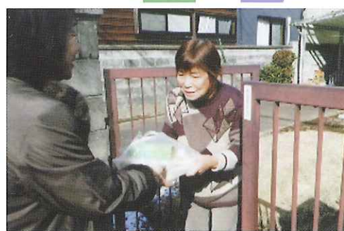
一人暮らしの高齢者への食事宅配