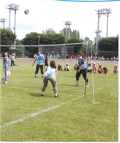
三世代が汗を流す… スポーツ大会