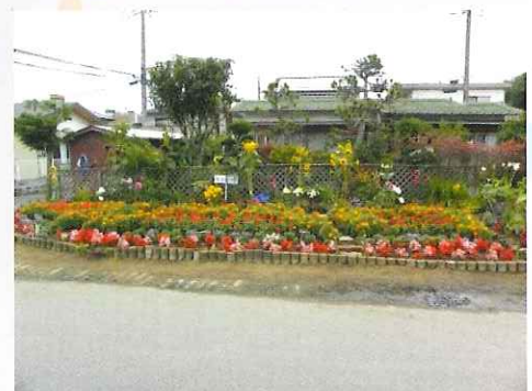
花いっぱいのもちづくり