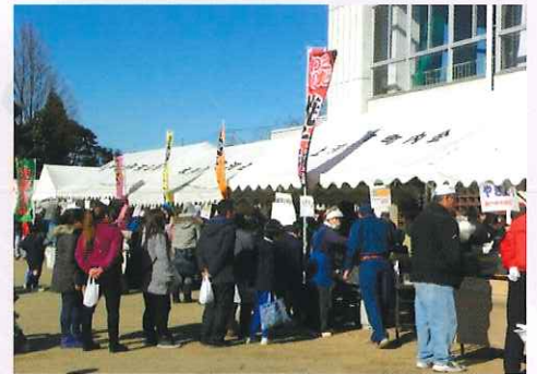
柳河ふれあいまつり