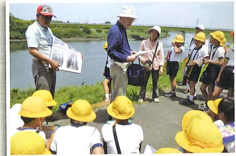
城東の歴史を巡る歩く会（城東地区自治団体連合会）