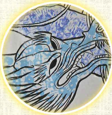
城東小学校のシンボル蒼龍

ぼくは、この城東小学校が141年も続いたことに感謝しています。これからも、この城東小学校がずっとこの町に残っていることを信じています。伝統ある城東小学校に通う未来の子どもたちに、守ってほしいお願いが二つあります。一つ目は「自然を守る」二つ目は「シンボルを大切に」です。ここはいざというときの避難場所にもなります。どんなときもポプラの木を中心に、城東小学校の元気を地域に発信していくことを、ぜひ引き継いでもらいたいです。