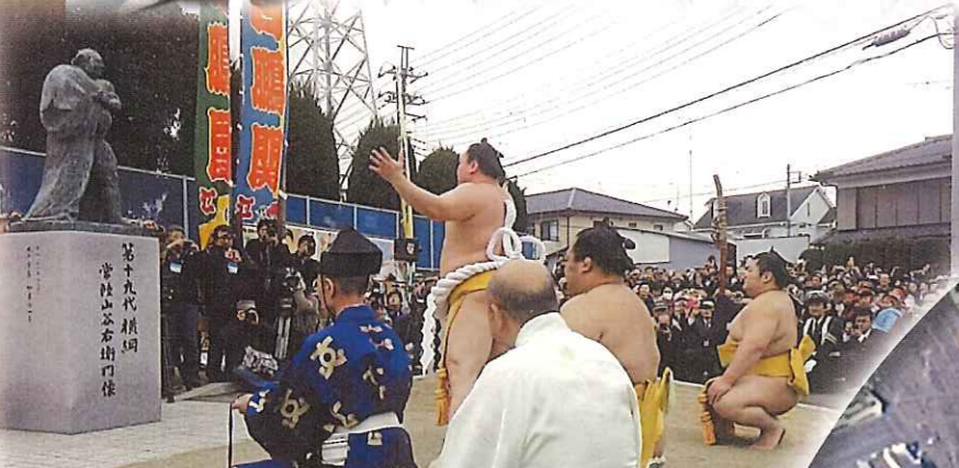
常陸山生誕140年・横綱 白鵬 土俵入り奉納 2014年12月20日