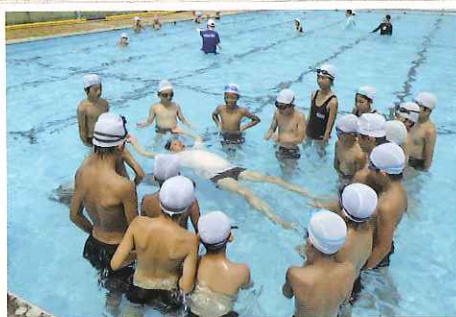
水府流体験学習（城東地区自治団体連合会）