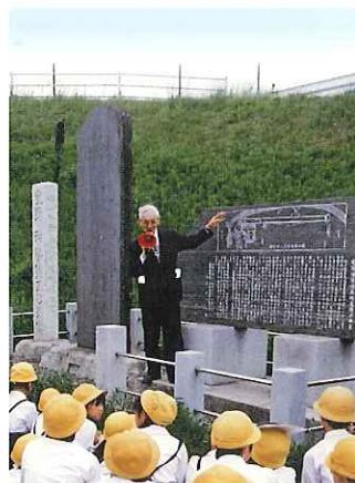
神勢館・五町矢場碑