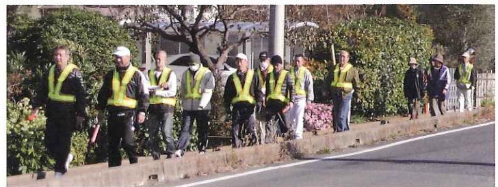
避難経路の確認訓練