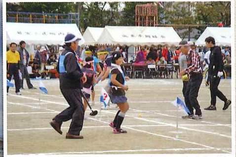
城東市民運動会（城東地区自治団体連合会）