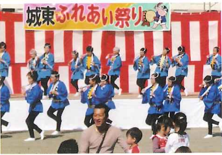
城東ふれあい祭り（城東小PTA）