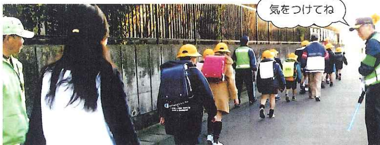
「子どもを守る会」の皆さん