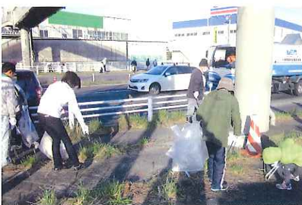
みんなで清掃活動