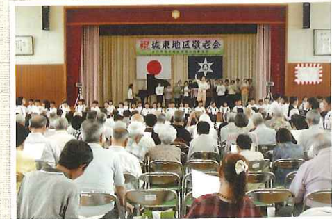
敬老会（社会福祉協議会城東支部）