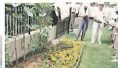
花壇コンクール審査