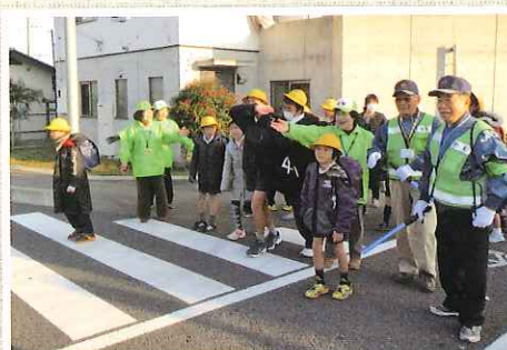
登下校の見守り、交通安全指導（城東防犯子供を守る会、東台交番管内防犯連絡員協議会）