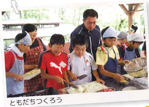
ともだちつくろう