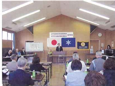
自治団体連合会・社協城東支部合同総会