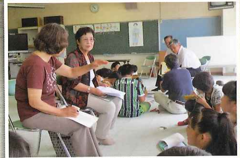
城東の歴史を聴く会（社会福祉協議会城東支部）