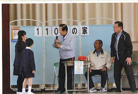
110番の家駆け込み訓練（水戸警察署、防犯ボランティア）