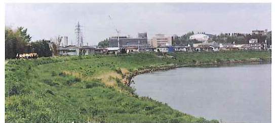
自然豊かな那珂川