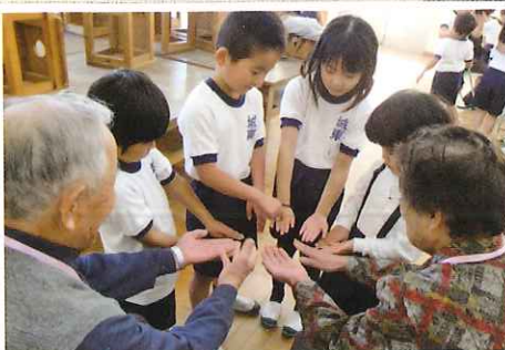
昔遊びをしよう（高齢者クラブ）