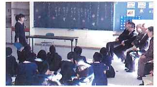
小学校との交流会